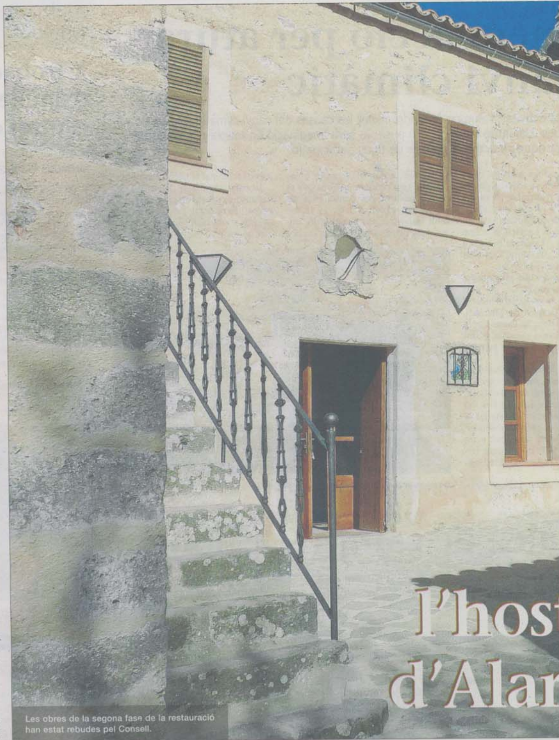
Les obres de la segona fase de la restauració han estat rebudes pel Consell.

El 2003 es redactà el projecte d'execució que determinava que les obres es durien a terme en dues fases. En la primera es realitzaren actuacions de sanejament, subministrament d'aigua i electrificació, que afectaven tota l'obra, a més de la rehabilitació de les edificacions que envolten el claustre. En la segona fase, que fou rebuda divendres, les obres