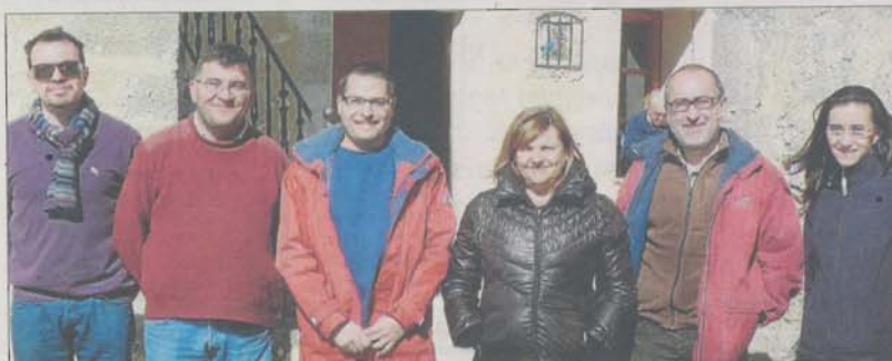
Les autoritats locals i del Consell de Mallorca visitaren divendres passat les obres de restauració.

El Departament de Medi Ambient del Consell de Mallorca ha aportat el projecte, la direcció i la mà d'obra per un valor de 400.000 euros