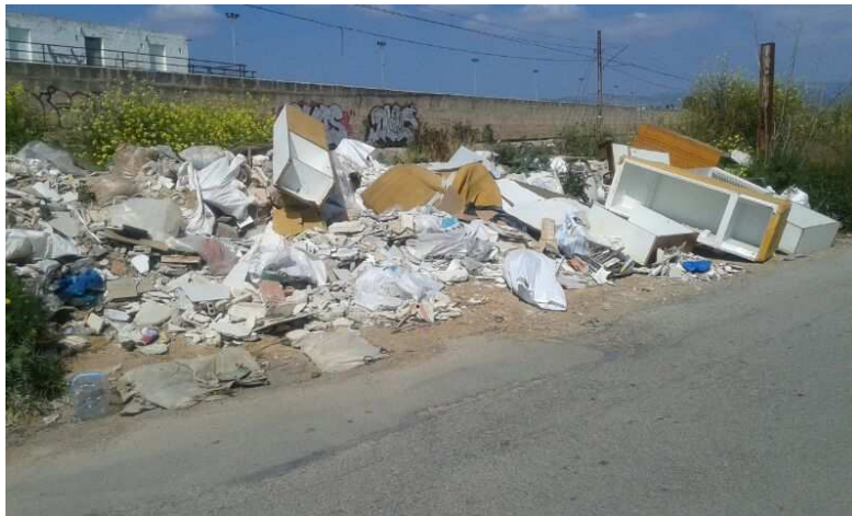
San Francisco de Sales

MÉS per Palma sempre ha denunciat aquests abocadors per a que Cort hi posi les mesures necessàries per a eradicar aquest problema que s'estén per tot el municipi. El abocadors incontrolats a més de ser un focus de contaminació per l'aigua, la terra i l'aire, són un risc per a la salut pública. Per tant, és una clara vulneració de l'article 1 de l'ordenança municipal de neteja, deixalles i residus sòlids urbans que té per objecte: "La protecció, a l'àmbit dels mitjans i els instruments proposats per aquesta ordenança, de la salut i la higiene públiques, del medi ambient i l'entorn urbanístic". Sense cap dubte aquesta és una pràctica incívica e irresponsable, a més d'il·legal, per part d'aquelles persones que aboquen residus provinents de la construcció, alguns d'ells tòxics i perillosos, i altres tipus d'objectes: electrodomèstics, pots de pintura, rodes de goma, mobles, fustes, canonades de PVC, bateries, vidres, etcètera.