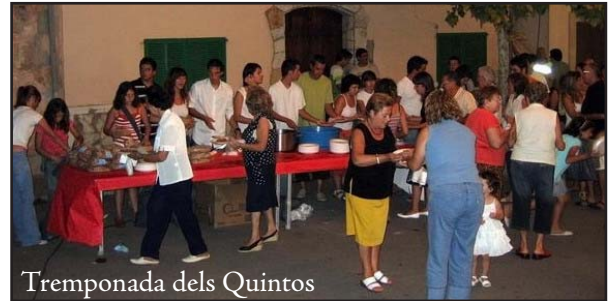
Tremponada dels Quintos

La festa de la Mare de Déu: tot un paquet negociat, no importa el que costa, així és bo d'organitzar, només basta comanar, i després pensar a pagar. El que manco importa és la participació.